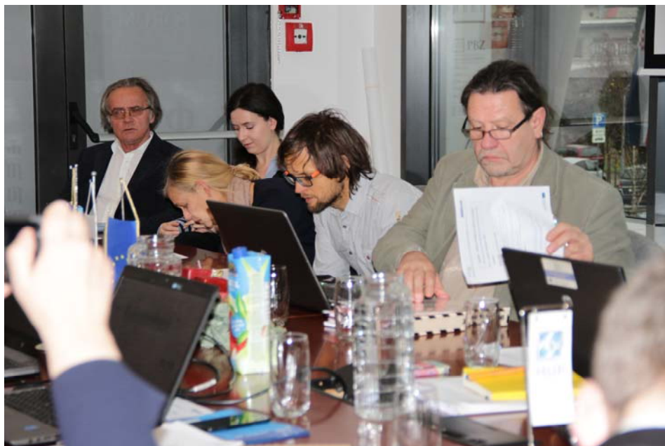
CPI Slovēnijas pārstāvis prezentēja 3. Darba pakas (Mācību programmas izstrāde) aktivitātes.

Prezentācijas raisīja detalizētu diskusiju par izvēlēto trūkstošo prasmju jomām. Pārstāvji vienojās, ka prezentētās trūkstošās prasmes ir diezgan plašas, tādēļ ir nepieciešams precizētšis jomas, izvēloties vienu prasmī, kas būtu vispiemērotākā visiem dalībniekiem. Partneri vienojās par izvēlētajām prasmēm un noteica pamatu turpmākai mācību programmu izstrādei.